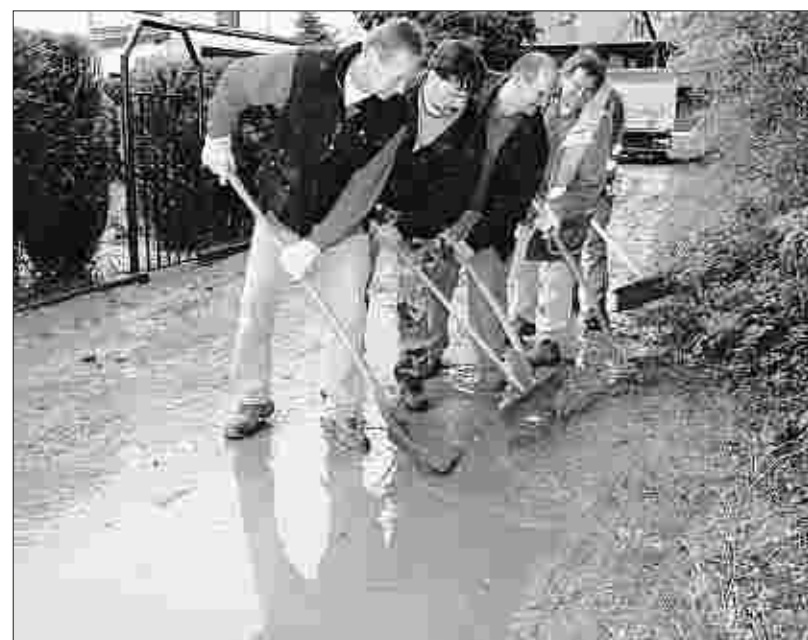
Mitarbeiter der Gemeinde Kreuzau räumten gestern Morgen in Üdingen die vom Schlamm bedeckten Straßen mit Schippe und Besen. Im Dorf waren nahe beim Bahndamm zahlreiche Keller überflutet.