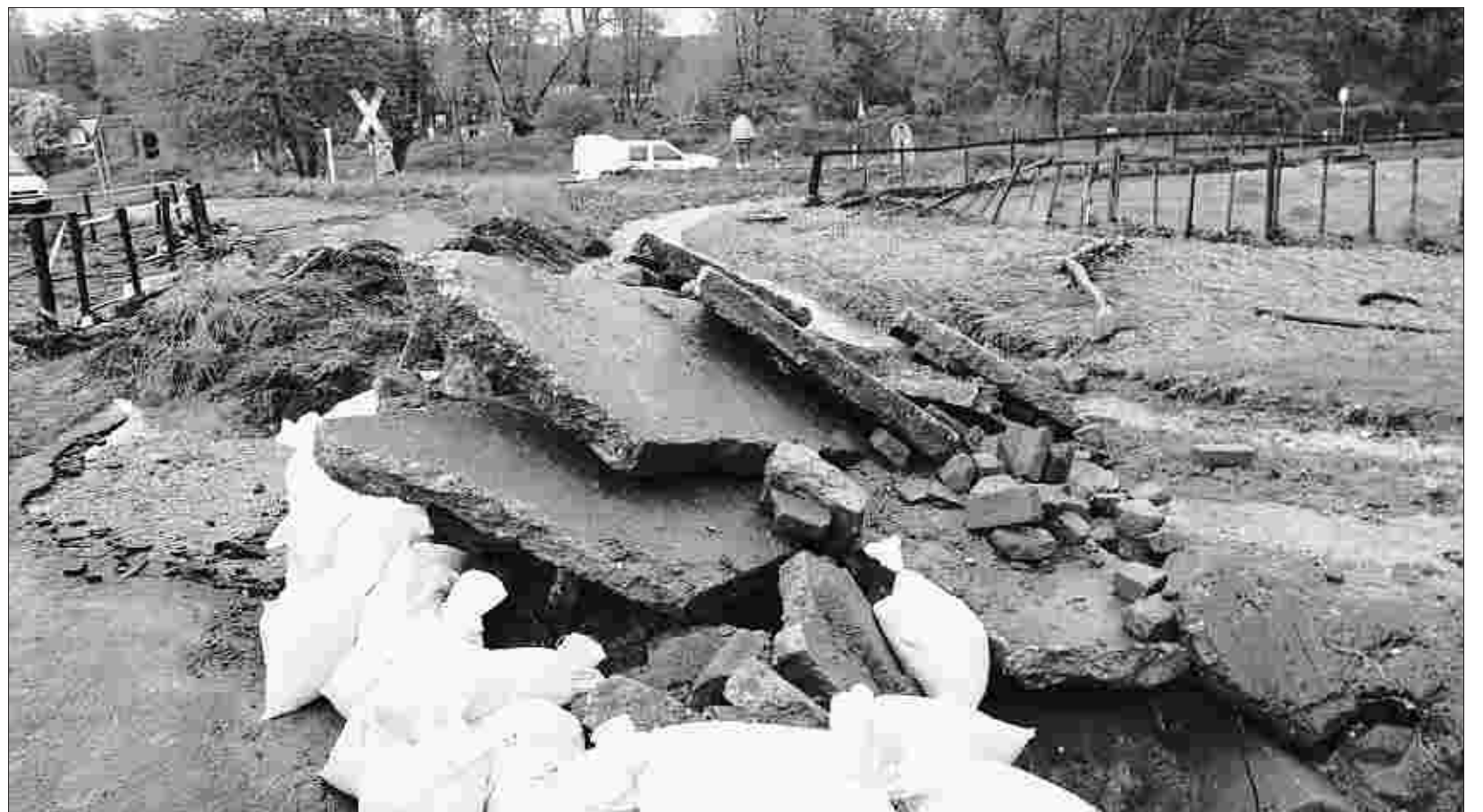
Die Wassermassen, die vom Lohberg in das Rurtal strömten, rissen Geröll und Schlamm mit. Seit Montagabend waren dadurch die Schienen der Rurtalbahn blockiert. Nach den Aufräumarbeiten fuhr erst gestern Mittag wieder der erste Zug.

Das war mehr, als Bäche, Gräben und Rohre fassen konnten. In Üdingen hieß es am frühen Abend Land unter. Der Prontz-Graben schwoll zum reißenden Bergbach an und riss Geröll und Schlamm mit talwärts. Dort wurden die Gleise der Rurtalbahn überspült